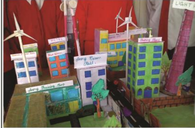
ৰাষ্ট্ৰীয় প্ৰযুক্তি দিবস

■ স্থানীয় অভিজ্ঞ ব্যক্তিক জড়িত কৰি ওপৰোক্ত ক্ৰিয়া-কলাপ খিনি পৰিচালনা কৰিব আৰু বিশিষ্ট ব্যক্তিৰ দ্বাৰা বিজ্ঞানৰ জনপ্ৰিয় বক্তৃতা অনুষ্ঠিত কৰিব।