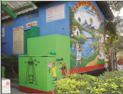
বিশ্ব জল দিবস

২২ মাৰ্চ: পানীৰ সংৰক্ষণ সন্দৰ্ভত শিক্ষকে এই দিবসৰ তাৎপৰ্য চমুকৈ ব্যাখ্যা কৰিব। ছাত্ৰ ছাত্ৰীয়ে প্ৰস্তুত কৰা শ্ল'গান, প'ষ্টাৰ, ছবি আদি বিদ্যালয় চৌহদৰ উপৰি অঞ্চলৰ সুবিধাজনক ঠাইত আৰিব।