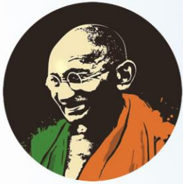
মোহনদাস কৰমচাঁদ গান্ধী