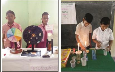
ৰাষ্ট্ৰীয় বিজ্ঞান দিবস